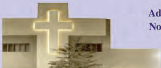
Jejuicki Ośrodek Milenijny

W pierwszy piątek miesiąca - od 17:30 do 19:30